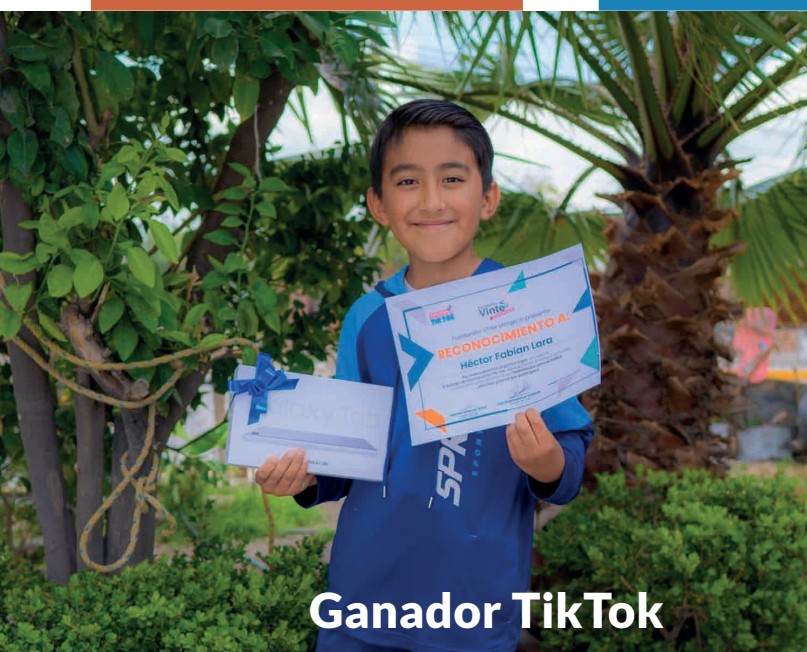
Ganador Tik Tok